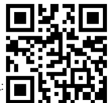
칼럼 전문 QR 코드: